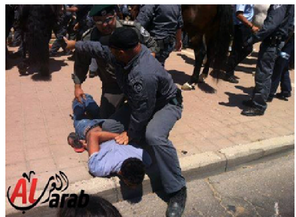
Policía israelí arresta a un manifestante en una protesta contra el Plan Prawer el 15 de julio de 2013.

En las primeras horas de la mañana del 17 de julio de 2013, las Fuerzas Especiales irrumpieron en la prisión de Ayshel y atacaron a los prisioneros. Finalmente, pusieron a 4 prisioneros en confinamiento e hirieron a docenas. Similarmente, el 29 de julio de 2013, la celda 11 de la prisión de Askalan fue allanada en medio de la noche y los prisioneros fueron desplazados al patio de la prisión mientras las Fuerzas Especiales hacían la redada y registraban su celda. Los prisioneros informaron de que las Fuerzas Especiales estaban armadas y llevaban granadas de gas.