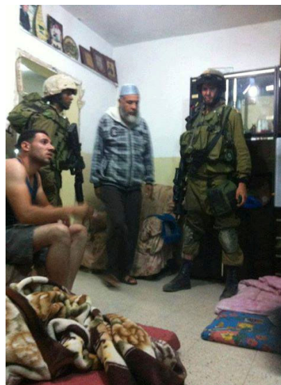
Foto de una redada en una casa en el campo de refugiados de Yalazone, cerca de Ramala, el 2 de julio de 2013 .